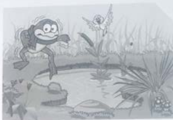
Sapo Jururu, na Beira do Rio... Uma das canções do repertório, com arranjo de Villa-Lobos.